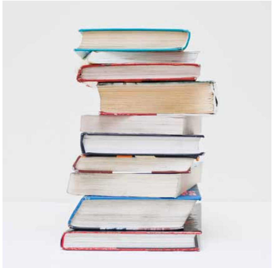
Russische Bücher, 2010, Fotografie, 90x90 cm Russian Books, 2010, photography, 90x90 cm