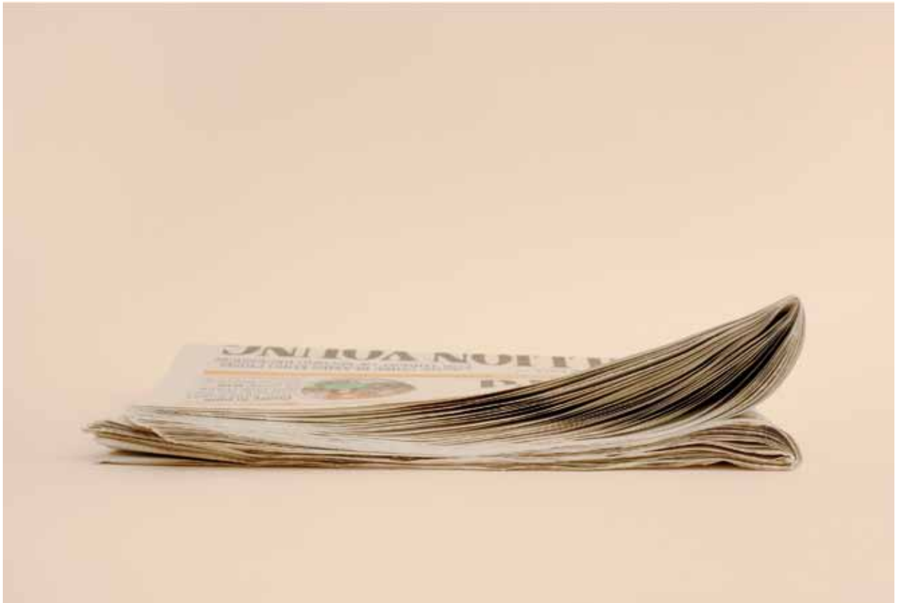
"Involuntary Reader" (16 Nov 2011, London Evening Standard), 2012, Giclée- Druck auf Hahnemühle Potorag, 30x40 cm "Involuntary Reader" (16 Nov 2011, London Evening Standard), 2012, Giclée print on Hahnemuhle Potorag, 30x40 cm