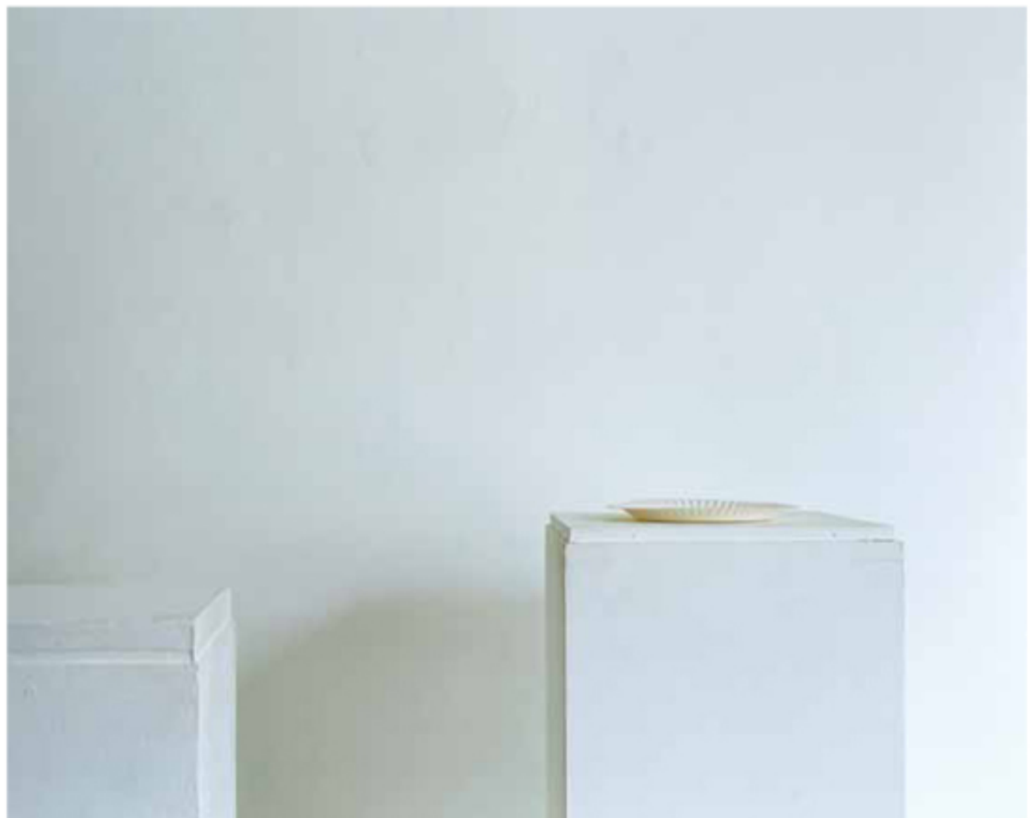
Invisibility 2 , 2009, Fotografie, G-Type Print, 60cm x 75cm Invisibility 2 , 2009, photography, G-type print, 60cm x 75cm